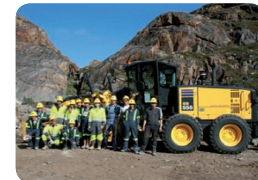
Eleverne fra Mineskolen.

Afstandene er store i Grønland, så store at fragt er meget dyrt. "Det kan nemt koste 90.000 kr. at levere en middelstor maskine og 35.000 kr. at få en minilæsser frem, så transport er en stor post i budgettet" siger Preben Bach fra XL-BYG Arctic Import.