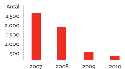
Salg det første halve år:

Hos Scantruck har vi trods de svære tider øget omsætningen i årets første seks måneder i forhold til samme periode sidste år.