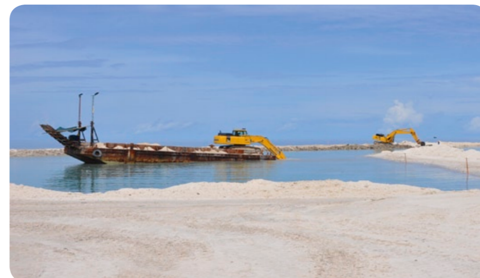
Komatsu fjerner sand og fylder op med sten for at sikre de meget lavtliggende øer.